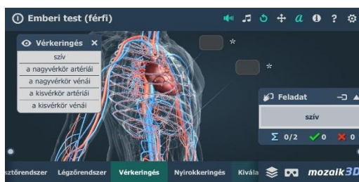
1. ábra – 3D Az emberi test applikáció

A) Töltsék le a mozaik „3D Az emberi test applikációt”! Tekintsék meg az applikáció animációját! Gyűjtsék ki a projektfeladatukhoz kapcsolódó tananyagot!