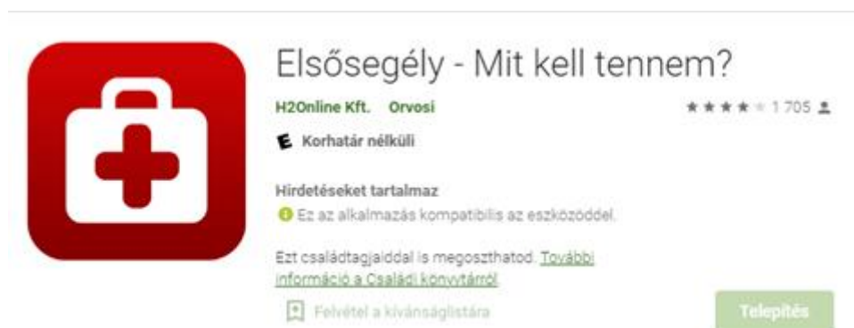
4. ábra - Az Elsősegély – Mit kell tennem? applikáció adatai

C) Elkészítenek egy folyamatábrát az elsősegélynyújtás lépéseiről a konkrét szituációban tetszőleges applikációban (Word, Padlet, Learningapps stb.) a lehetséges ellátási kimenetekkel, és feltöltik a Teams-be.