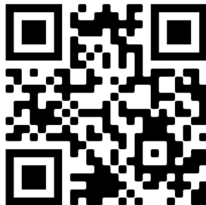
2. számú ábra: A létrehozott QR-kód

A kód elkészítése után a csapat tagjainak mobiltelefonra letölthető QR-kód leolvasó applikációt kell találniuk, a mobiltelefonok operációs rendszerének függvényében.