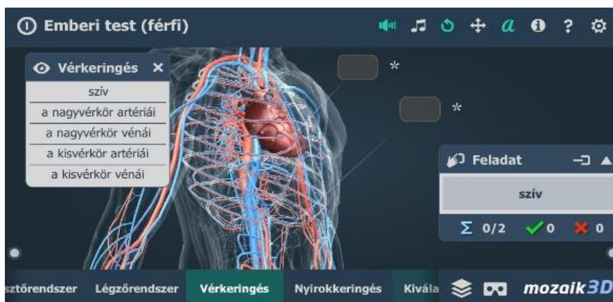
1. ábra – 3D Az emberi test applikáció

A) Töltsék le a mozaik „3D Az emberi test” applikációt! Tekintsék meg az applikáció animációját! Gyűjtsék ki a projektfeladatukhoz kapcsolódó tananyagot!