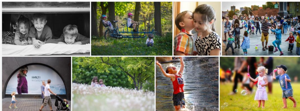
3. ábra: Fotómontázs az adott foglalkozás témájáról, készült a flickr.com segítségével

A csoporttagok megbeszélnek egymás között, ki mutatja be a csoport munkáját. Az 5. foglalkozás végén nem a csoporttagok értékelik egymást a 3-2-1-értékelőlapon, hanem a csoportok egymást értékelik, a csoporton belüli konszenzus alapján. 4. sz. melléklet: 3-2-1-értékelőlap