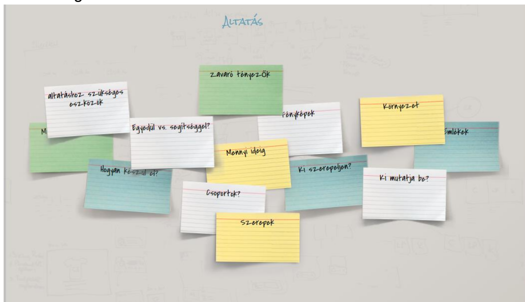
1. ábra: Altatási feladatok (ötletbörze a scrumblr alkalmazás segítségével)

A végleges lista létrejöttét ötletbörze előzi meg, ahol a tanulók és az oktató együtt átbeszéli a foglalkozások menetét.