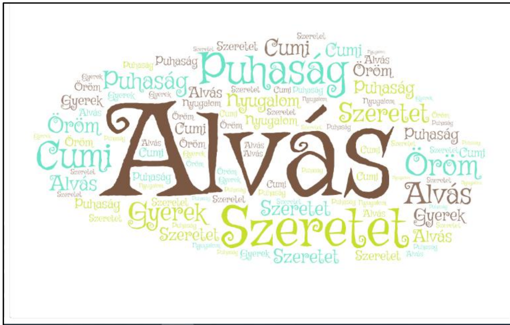
4. ábra: Szófelhő a WordArt segítségével, az alvótársakkal kapcsolatos szavakból

Miután ráhangolódtak a feladatra, jönnek a témakör kérdései, amelyeket a csoportok az előbbieken használt módon dolgoznak fel, adnak elő és értékelnek: